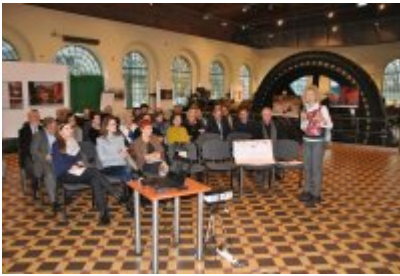
• Rewitalizacja 17.11.2015