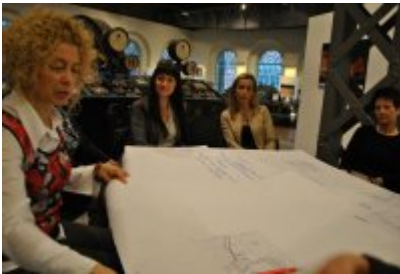
• Rewitalizacja 17.11.2015