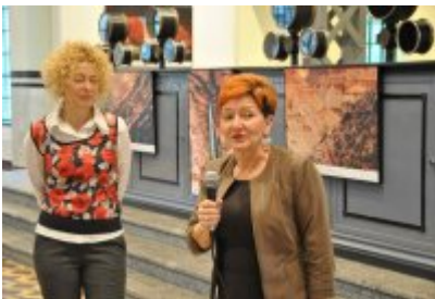
• Rewitalizacja 17.11.2015